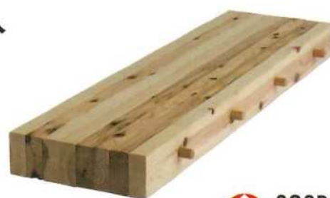
DLT製造方法特許 第6976005号

DLT (Dowel Laminated Timber) は木ダボのみで接合し、製造時に接着剤や釘を使用せず100%木材から出来ている積層材です。意匠材や構造材として活用が可能な素材で、木材の加工性の良さを生かして、多彩な表面意匠が可能です。また小規模な設備でも製造可能なことから、中小製材工場での少量多品種型の生産に適し、製造時や廃棄時の環境負荷が小さい点も期待されている素材です。長谷萬グループでは、DLTの国内の普及に向けて、技術や用途の開発を進めながら、様々な施工実績を積み重ねています。